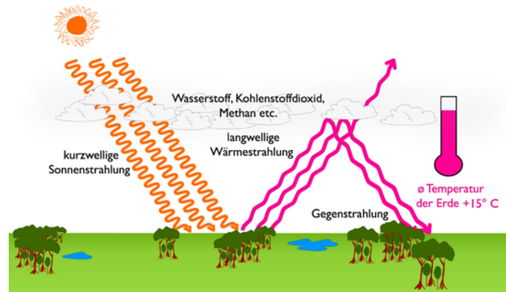
Der natürliche Treibhauseffekt

Mit dem Klimawandel ist also die zunehmende Erwärmung der Erde gemeint, die durch die Lebensweise von uns Menschen verursacht wird.